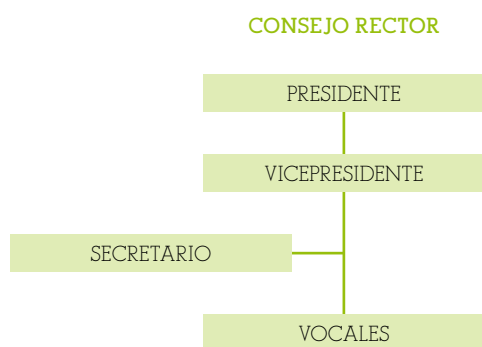
Figura 1. Composición del Consejo Rector de la Agencia